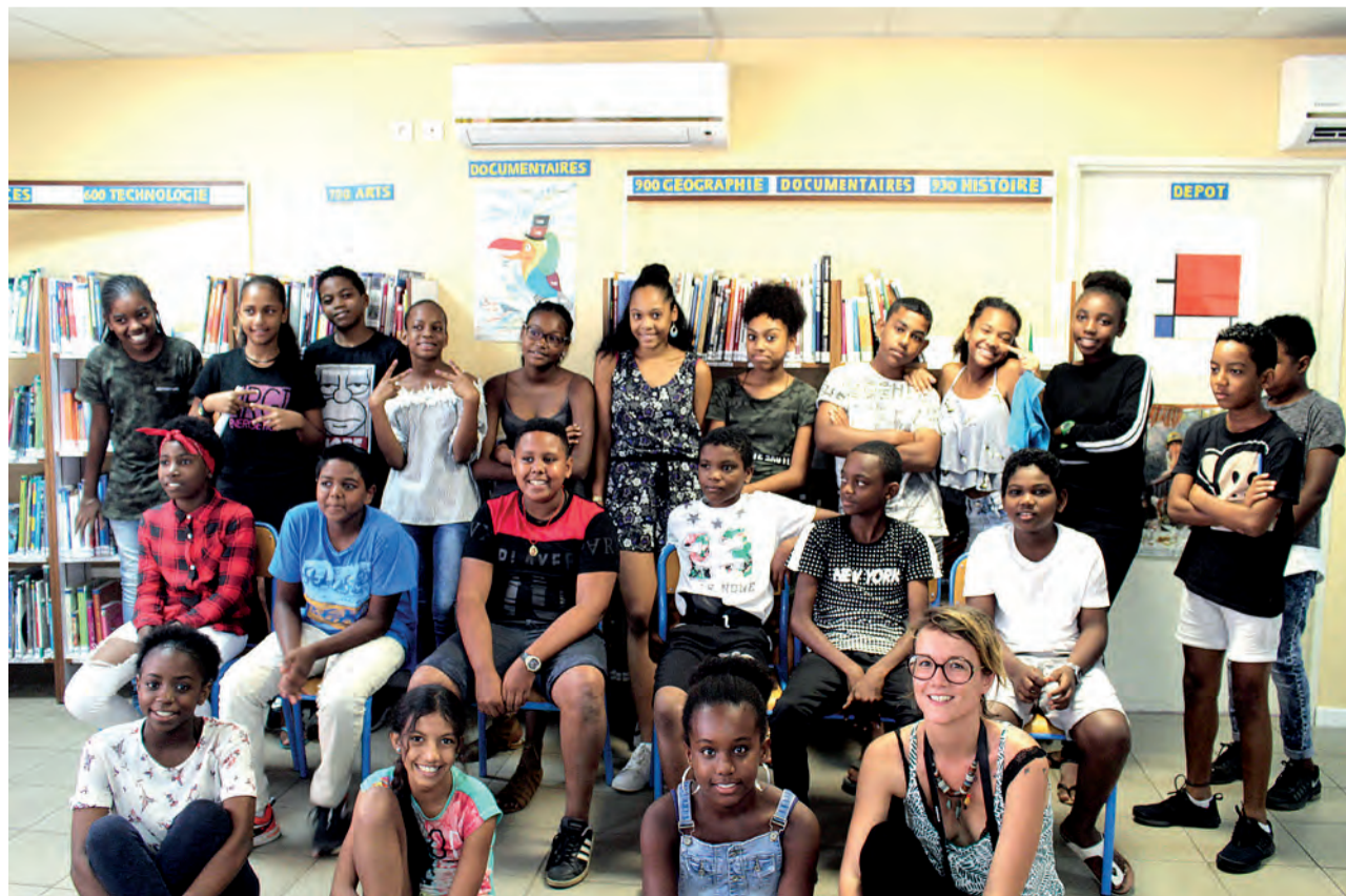
Cinq classes réunionnaises participent au projet. Un record !